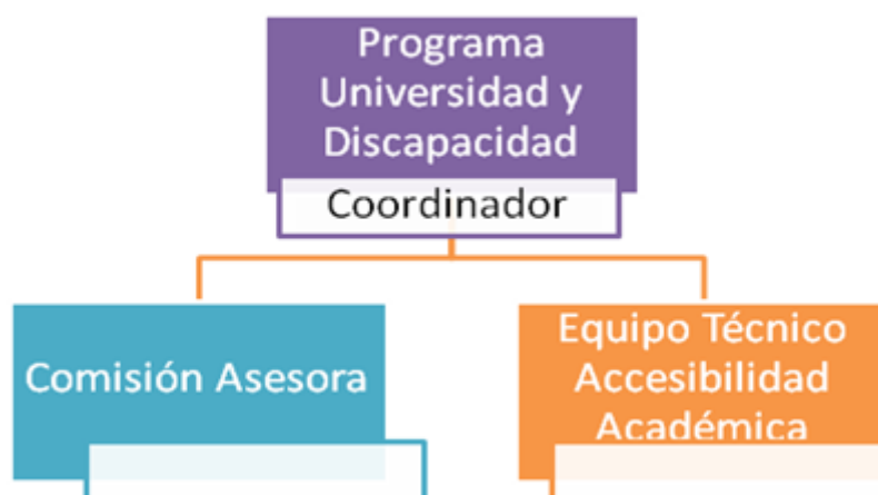
Figura 1-Estructura y Organización